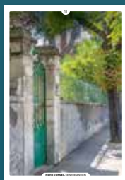
11 les clôtures

Chaque intervention sur les façades de nos centres anciens compte et participe à l'harmonie du paysage urbain. Au cœur de nos villes et villages, l'intérêt particulier et l'intérêt général doivent être conjugués pour créer le cadre de vie que nous y recherchons tous.