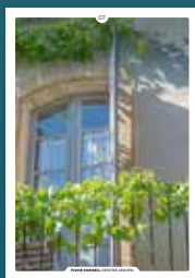
07 les fenêtres