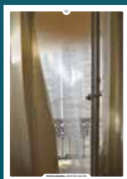
15 le confort thermique

Chaque intervention sur les façades de nos centres anciens compte et participe à l'harmonie du paysage urbain. Au cœur de nos villes et villages, l'intérêt particulier et l'intérêt général doivent être conjugués pour créer le cadre de vie que nous y recherchons tous.