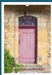
09 les portes