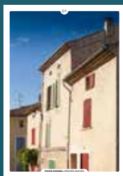
01 les façades enduites

Chaque intervention sur les façades de nos centres anciens compte et participe à l'harmonie du paysage urbain. Au cœur de nos villes et villages, l'intérêt particulier et l'intérêt général doivent être conjugués pour créer le cadre de vie que nous y recherchons tous.