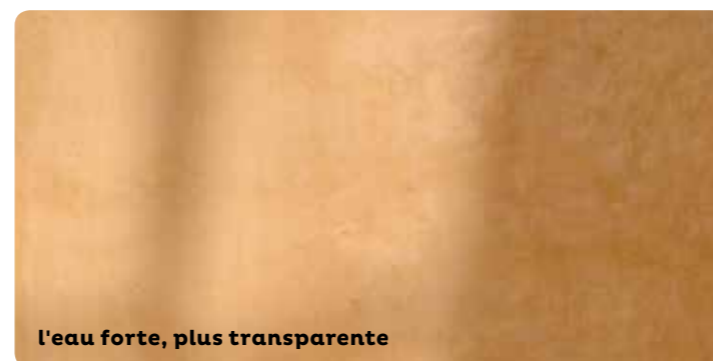
l'eau forte, plus transparente