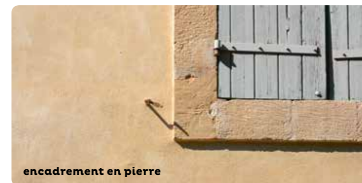
encadrement en pierre