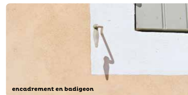
encadrement en badigeon