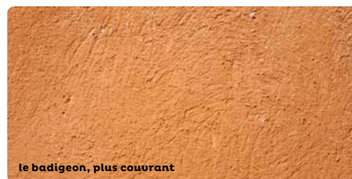
le badigeon, plus couvrant

Le fond de façade en enduit doit être vérifié par un examen attentif. Analysez les teintes de badigeons existants avant restauration ou décroûtage. Consultez un professionnel (artisan-maçon ou architecte) pour le diagnostic, le suivi et la réalisation des travaux.